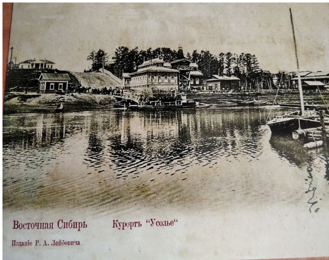
Восточная Сибирь Курорт "Усолье" Издание Р. А. Лейбовича

В 1848 году опытами дознана целебность ванн из соляной воды. По случаю этому устроено особое заведение с ваннами, которыми пользуются жители для лечения.